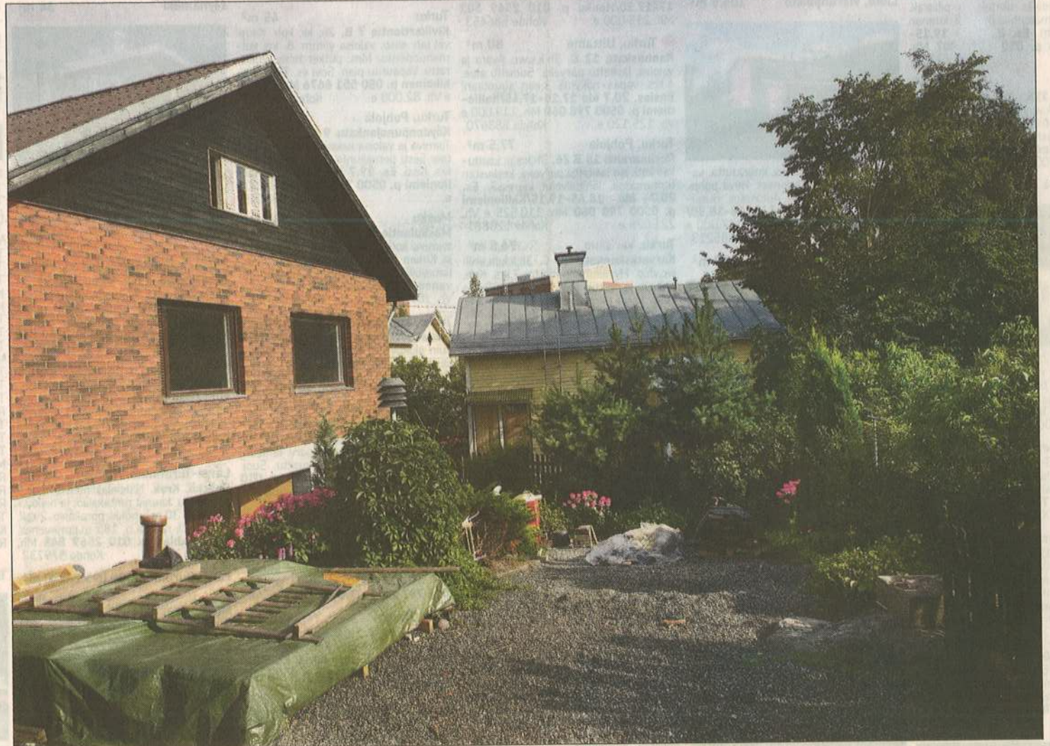
Omakotitalon edustalle kaivataan isoa terrassia, jossa olisi paikka isolle pöytäryhmälle ja grillille.

Muutokselle ei anneta tarkkaa budjettia, sillä asukkaat halusivat saada suunnitel-man, jota voisi toteuttaa hiljalleen.